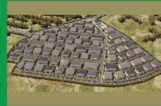
Lotus Alya Bahçe