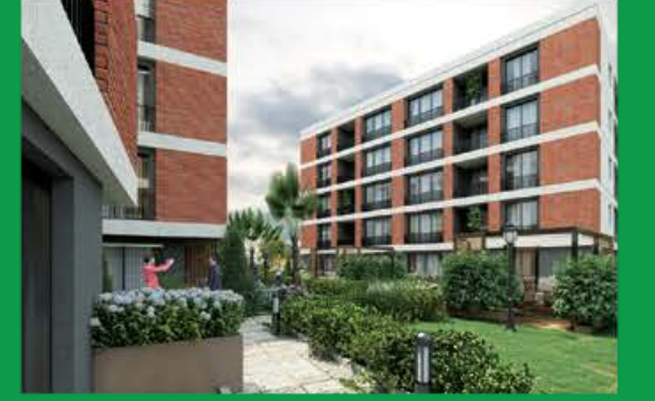
Lotus Mimaroba 2