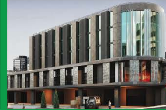
Lotus Ticaret Merkezi